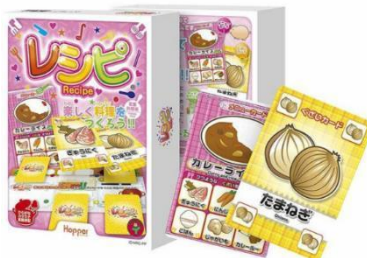
食材を集めて料理を完成させる カードゲーム