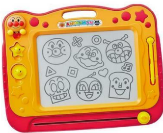
アンパンマンが上手に描ける ちやうお絵描きボード

サポートの際に人気のおもちゃを是非ご活用ください。 ファミサポで貸出しを行っています。